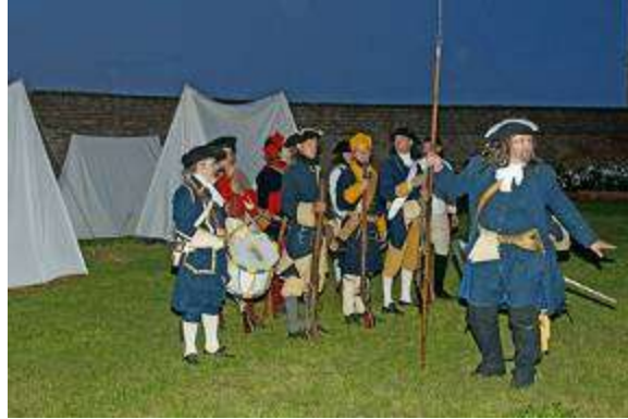
Ziemeļu kara notikumu mūsdienu atainojums