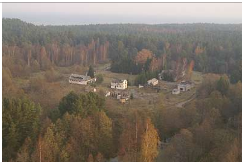
23. attēls. Robežapsardzes postenis pie Irbes upes grīvas.