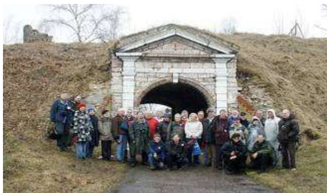
16. attēls. Baltic Fort Route delegācija Daugavgrīvas cietoksni

Pēdējā laikā lielu interesi par Daugavgrīvas cietoksni izrāda Eiropas organizācija Baltic Fort Route (BFR). 2011. gada aprīlī Latvijā ieradās BFR delegācija un apmeklēja Liepāju, Daugavpili un Rīgu. Delegācija pabija Daugavgrīvas cietoksni un uzsvēra, ka šeit trūkst tūrisma infrastruktūras, informācijas materiālu un ekskursiju pakalpojumu. Delegācijas sastāvā bija fortifikāciju saglabāšanas speciālisti no Vācijas, Polijas, Zviedrijas, Nīderlandes, Beļģijas, Francijas, Anglijas un citām valstīm.