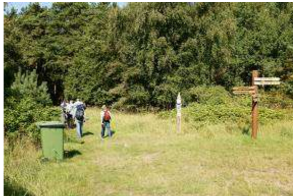
Kājnieku maršruts Aegnas salā

Aegnas (zviedru - Ulfsö, vācu - Wulf) sala atrodas 14 km ziemeļos no Tallinas ostas. Uz salas savulaik bija uzceltas krasta apsardzes baterijas Tallinas aizsardzībai pret uzbrukumiem no jūras puses. Tās "mainīja" savus īpašniekus, esot krievu, vācu, igauņu, tad atkal krievu, atkal vācu, pēc tam Padomju armijas krasta apsardzes baterijas. Aegnas sala ir unikāls kara vēstures "rezervāts". Sala pieder Tallinas pašvaldībai. Tā uz salas ir izveidojusi marķētus kājnieku un velo tūrisma maršrutus, informācijas standus, uzstādījusi atkritumu tvertnes. Uz salu var nokļūt no Tallinas ostas ar kuģīti vai privātām laivām.