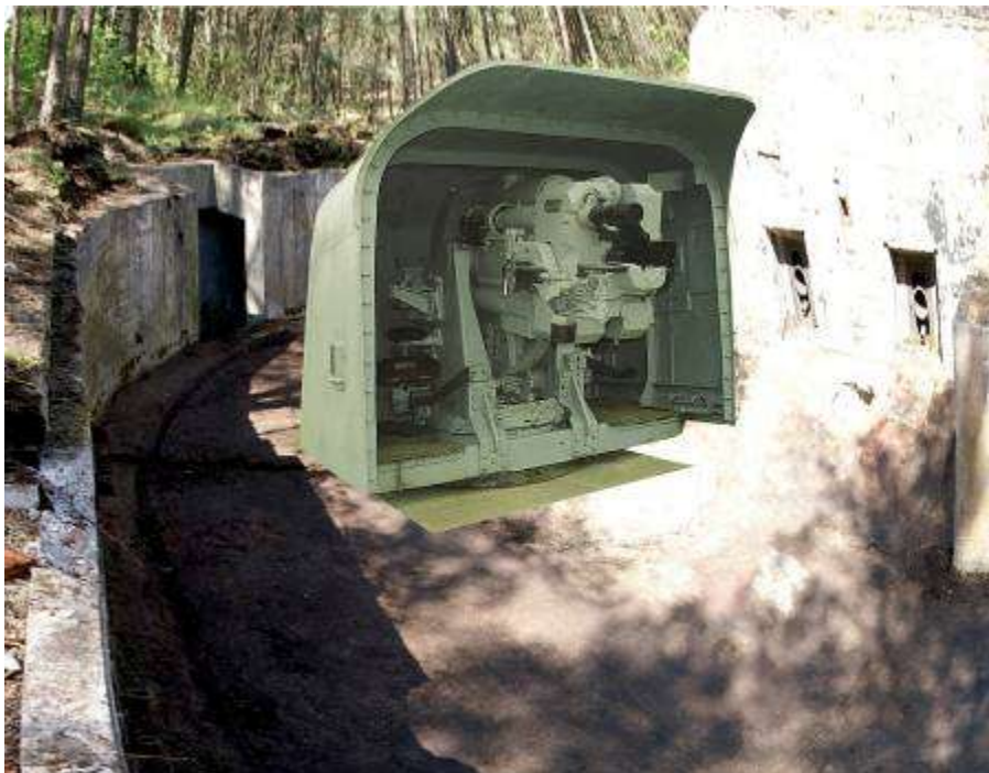
25. attēls. Lielgabala pozīcija ar lielgabala stobru pareizā virzienā