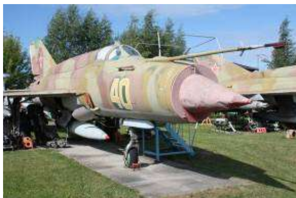
7. attēls. Rīgas aviācijas muzeja ekspozīcija (a,b).