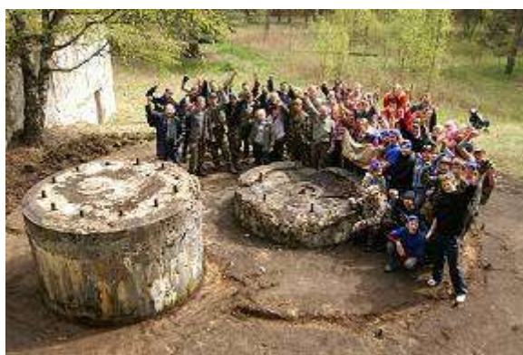
18. attēls. Talkas dalībnieki Mangaļsalā