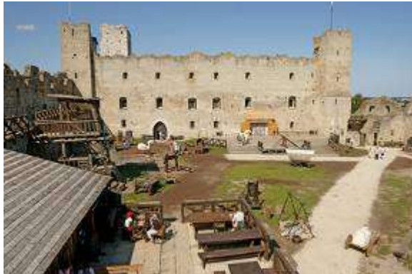
Rakveres pils dienvidu daļa

Labs rekonstruētas un tūrisma vajadzībām izmantotas pils piemērs ir apskatāms Rakveres viduslaiku pilī. Tur iespējams šaut ar loku, smēdē iepazīt kalēja darbu, pielaikot bruņinieka bruņas, doties izjādē ar zirgu, degustēt ēdienus, kas ir gatavoti pēc senajām receptēm. Te aplūkojama viduslaiku zobenu ekspozīcija.