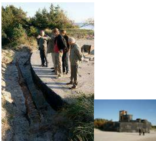
12,8 cm kalibra Flak 40 lielgabala stobrs un baterijas Memel-Nord komandpunkts

Baterijas „Memele-Nord” muzejā tiek organizētas lekcijas, ekskursijas un vēstures stundas skolu grupām, bet jūras krastā notiek teatralizēti uzvedumi, kur aktieri spēlē pret kara tēmu veltītas izrādes.