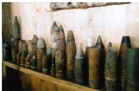
11. attēls. Kurzemes mežos atrastie artilērijas šāviņi.

Noteikti ir jāpiemin Kurzemes cietokšņa muzejs Zantē, ko izveidojis viens cilvēks – Ilgvars Brucis. Muzejā ir apskatāma bagātīga (> 8000 eksponātu) un saistoša militāra rakstura ekspozīcija par 1. pasaules karu un 2. pasaules kara darbību t.s. Kurzemes cietoksnī, kas ir muzeja galvenā tematika.