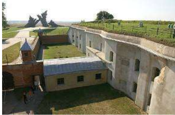
Devītais forts