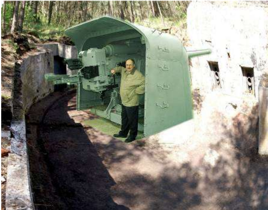
24. attēls. Lielgabala pozīcija ar vizualizētu lielgabalu tajā