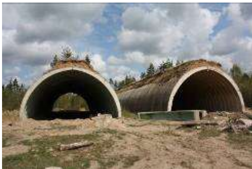
18. attēls. Knīpupju raķešu bāzes daļēji nojauktie angāri Apsaimniekotājs!!!

Zemāk attēlā redzamā objekta (Knīpupji) drošību ir grūti novērtēt un tas ir ļoti subjektīvs process. Ja objekts tiek aplūkots no blakus esošā ceļa vai betonētajiem laukumiem (distances vērošana), tā apskate ir droša. Savukārt, pārvietošanās tā iekšienē vai pa betona kupolu augšējo daļu saistīta ar risku veselībai vai pat dzīvībai. Tātad, svarīgs ir arī apskates formāts. Arī ainaviskais aspekts ir diskutējama lieta: no vienas puses tas ir degradēts grausts, no otras – šī „ainava” pārsteidz ar saviem izmēriem un „industriālo” pieskaņu. Drošību var uzlabot uzliekot attiecīgus norobežojumus, informatīvas zīmes, nodrošinot gidu pakalpojumus. Minētais objekts ir ieguvus tikai 2 punktus, tādēļ tā izmantošana tūrismā ir iespējama tikai veicot iepriekšēju pasākumu kompleksu esošās situācijas uzlabošanai.