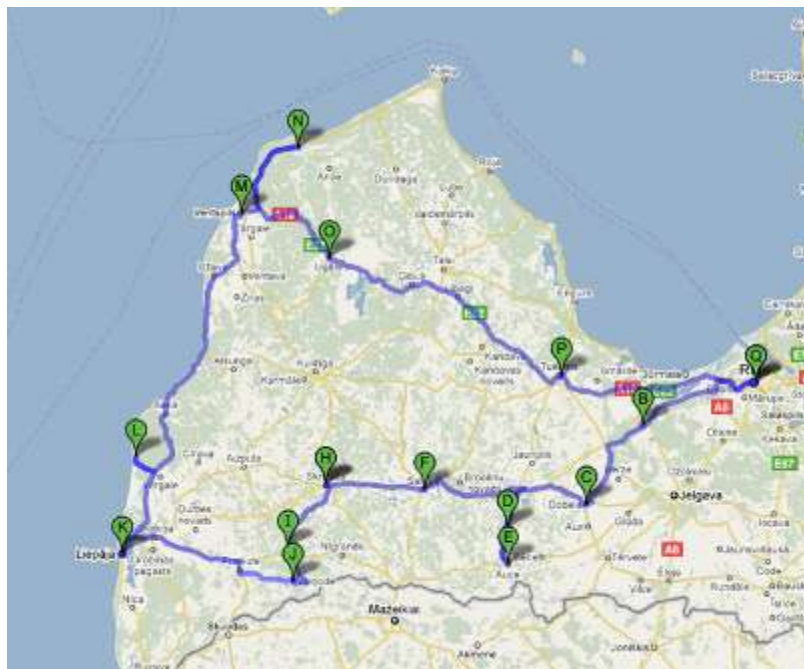
22. attēls. Ģeneralizēta maršruta pārskata karte ( Google com pamatne):

Ar šo simbolu atzīmēta NATURA 2000 teritorija (arī īpaši aizsargājama dabas teritorija). NATURA 2000 teritorijas ir Eiropas Savienības valstu radīts īpaši aizsargājamo dabas teritoriju (ĪADT) tīkls, kas Latvijā veidots uz jau esošo ĪADT bāzes ar mērķi aizsargāt Eiropā retas un apdraudētas augu un dzīvnieku sugas un to dzīves vietas (biotopus). Šobrīd Latvijā ir 337 NATURA 2000 teritorijas