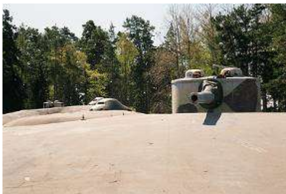
15 cm kalibra lielgabali Siaro salā

Zviedrijas jūras kara flote no Siaro forta aizgāja 1985. gadā. Pēc tam tajā sākās sagrūvums un vandālisms. Vandāļi ir visās valstīs – atšķiras tikai vietējo varas iestāžu reakcija uz vandālisma izpausmēm. 1993. gadā Siaro forts tika nodots Nacionālajai Nekustamo Īpašumu aģentūrai, un tika pieņemts lēmums par objekta restaurāciju un atvēršanu publiskai apskatei „ilustrējot Zviedrijas militāro vēsturi cīņā par mieru un atklājot XX gs. Zviedrijas vēstures mazpazīstamākos aspektus”. Valdība atvēlēja līdzekļus, restaurācijas darbi sākās 1995. gadā un tika pabeigti 1996. gadā. Mazāk nekā viena gada laikā forts tika sakārtots un atvērts apskatei. Siaro cietoksnim piešķīra muzeja statusu. Šodien objektu apkalpo trīs darbinieki, viņi arī vada kafejnīcu un nelielu viesnīcu, kas atrodas bijušajās kazarmās uz salas.