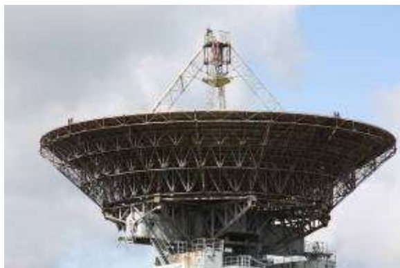
8. attēls. Irbenes radioteleskopa kopskats (a) un šķīvis (b).