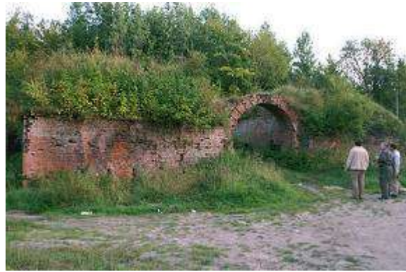
Sestais forts