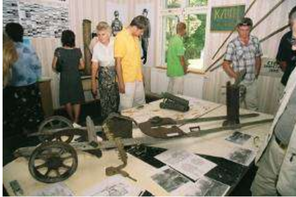
Kara muzejs Hījumā salas Tahkunas pussalā

Vērojot Igaunijas piemērus, ir jāsecina, ka tendence veidot vietējos kara vēstures muzejus kļūst arvien populārāka. Domājams, tā nākotnē ies tikai plašumā.