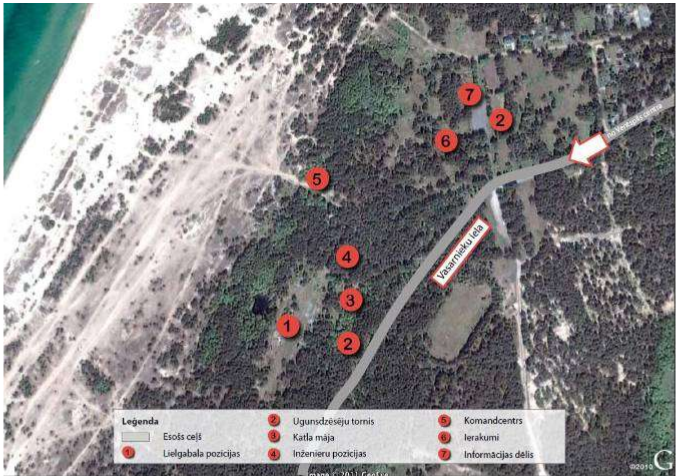
22. attēls. Ventspils apkārtnes aerofoto – Baterijas inženiertehnisko būvju novietojums.