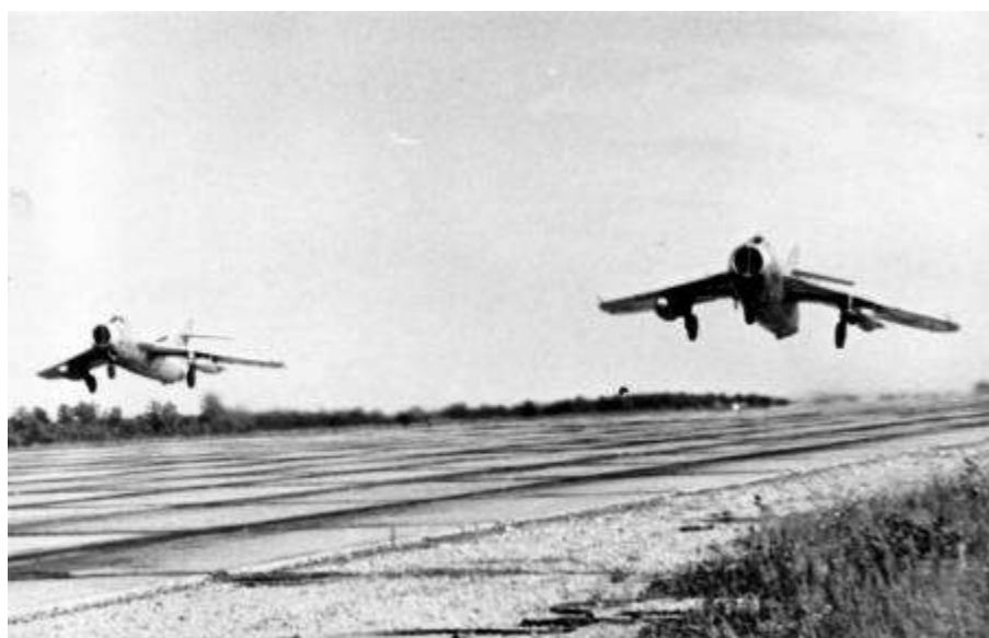
20. attēls. Padomju armijas iznīcinātāji Tukuma lidlaukā – savā ziņā unikāls foto.